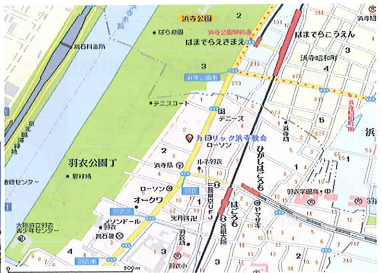
カトリック浜寺教会へのアクセス